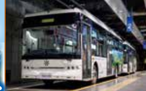
立山トンネル電気バス