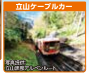
立山ケーブルカー